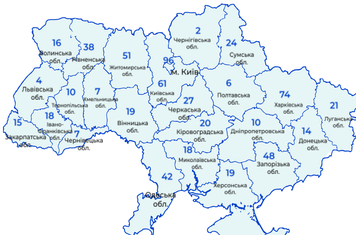
Рис. 4 Вебінари, проведені для працівників державних та комунальних закладів культури та закладів освіти сфери культури щодо політики безбар'єрності та недискримінації в регіонах

У межах пріоритету розширення доступності культурних послуг Держмистецтв забезпечило системне виконання завдань Національної стратегії із створення безбар'єрного простору до 2030 року та відповідних урядових планів заходів. На виконання Плану на 2023–2024 роки, затвердженого розпорядженням Кабінету Міністрів України від 25 квітня 2023 р. № 372-р, опрацьовано, узагальнено та подано до МКСК інформаційні матеріали щодо реалізації підпункту 1 пункту 41 напряму 2 «Інформаційна безбар'єрність» (цикл вебінарів для працівників державних і комунальних закладів культури та закладів освіти сфери культури з питань політики безбар'єрності й недискримінації) на підставі даних, надісланих обласними та Київською міською державними адміністраціями. У встановлені строки інформацію завантажено до ІС Project UA, що забезпечило повноцінну участь Держмистецтв у міжвідомчому моніторингу результатів. Згідно з узагальненими матеріалами, найбільша активність фіксувалася у м. Київ, Харківській і Київській областях, нижчі показники – у Чернігівській, Львівській та Полтавській областях (рис. 4), що враховано у комунікаційному плануванні та адресній роботі з регіонами.