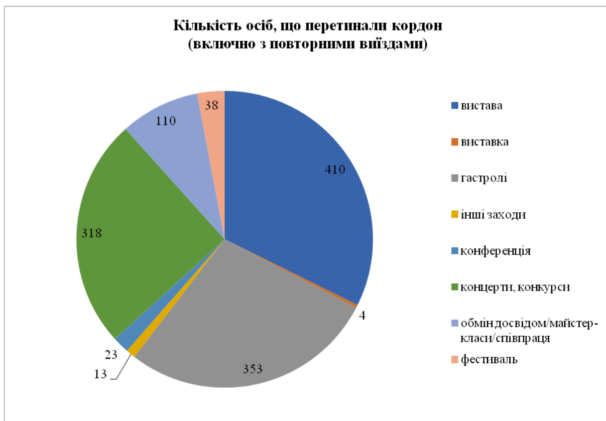
Рис. 2 Кількість осіб, що перетинали кордон (включно з повторними виїздами) у розрізі типів закладів культури

Переважно скористалися пунктами пропуску Устилуг (197 осіб, 22,4%), Краківець (192 особи, 13,2%) та Ягодин (120 осіб, 12,6%). Найменш популярними виявились пункти пропуску державного кордону Кучурган, Косино та Смільниця (рис. 3).