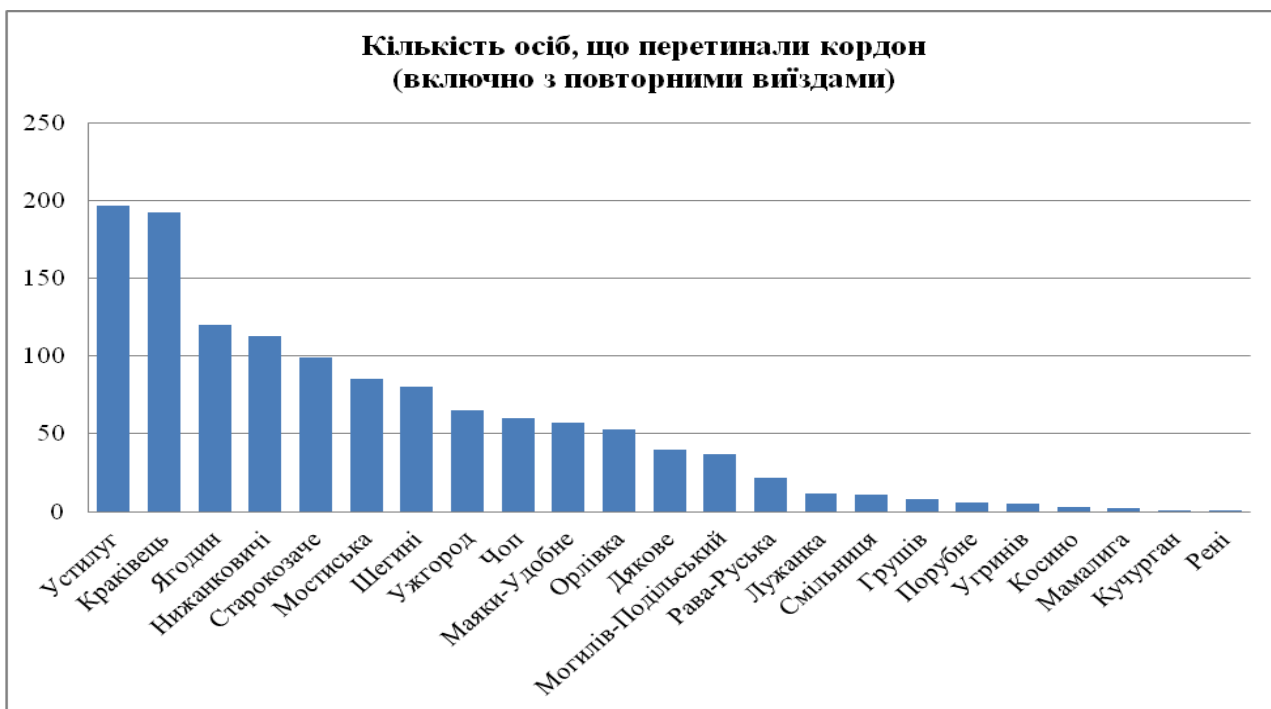
Рис.3. Кількість осіб, що перетинали кордон (включно з повторними виїздами) за пунктами пропуску державного кордону

За видами транспортних засобів найбільше перетинали кордон автомобільним транспортом – 648 осіб (51,0%), залізничним транспортом скористалися 295 особи (23,2%), автобусом – 325 особи (25,6%) і 1 особа скористалася пішохідним пунктом пропуску (табл. 3).