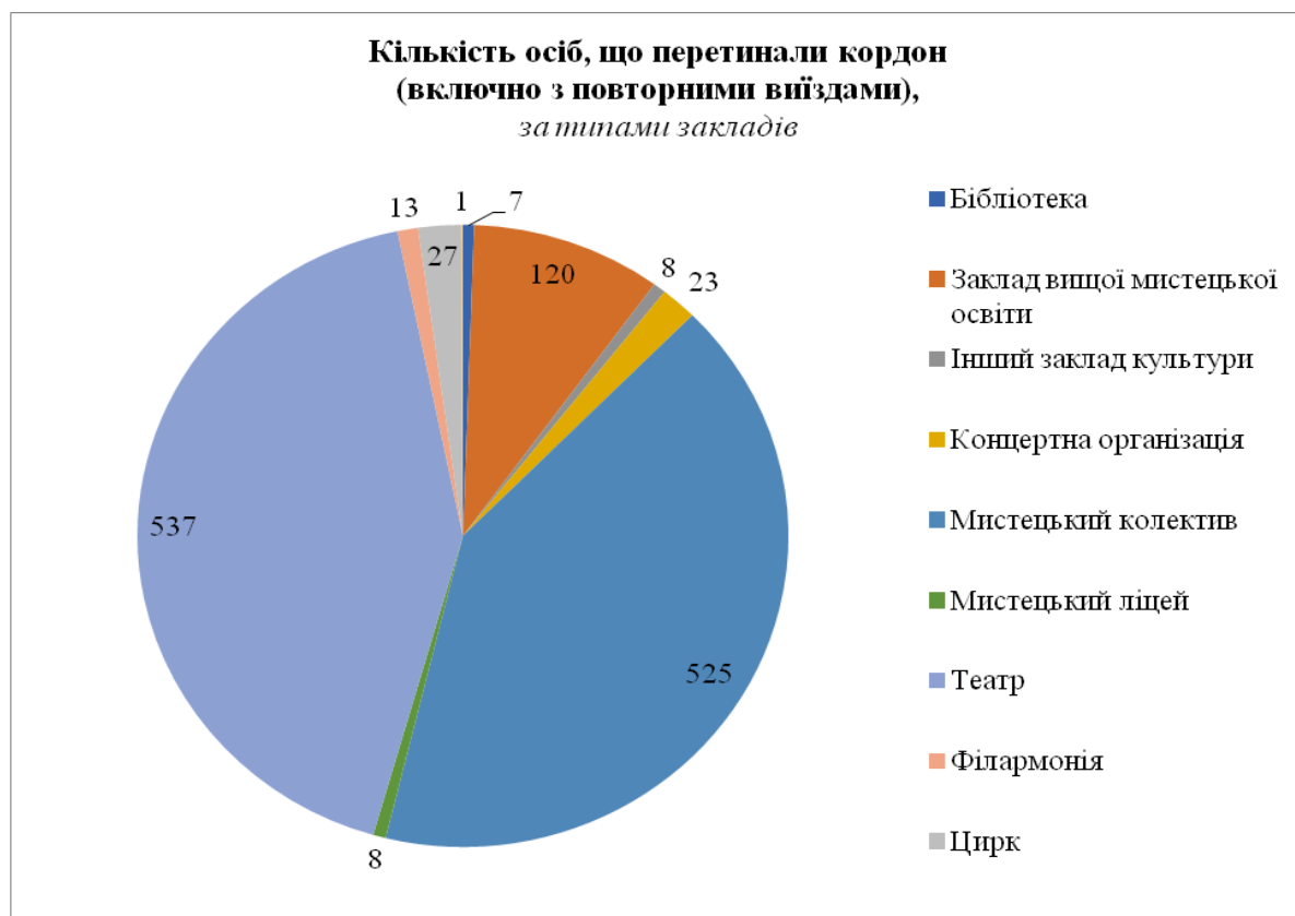
Рис. 1 Кількість осіб, що перетинали кордон (включно з повторними виїздами) у розрізі типів закладів культури

Найчастіше митці, що є військовозобов'язаними, виїжджали для участі у виставах – 410 осіб, що становить 32,3% від кількості осіб, що перетинали кордон (включно з повторними виїздами) та концертах та конкурсах – 318 осіб (25,0%). Кожен п'ятий фахівець перетнув кордон для участі у гастролях (табл.2, рис.2).